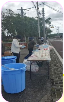
八重守の塔バス停前