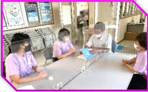
八重山毎日新聞社 令和3年12月24日(金)