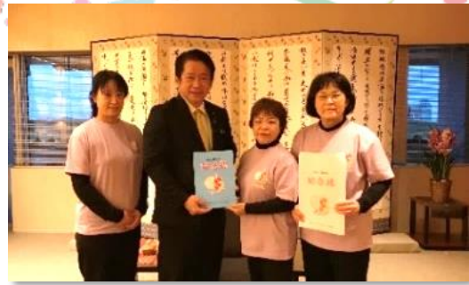
石垣市役所 令和3年12月27日(月)