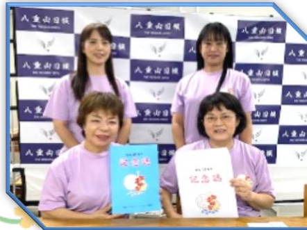
八重山日報 令和3年12月24日(金)