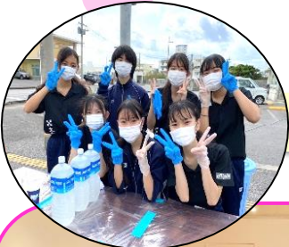
中学生も頑張っていました