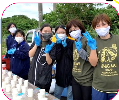
県道新川白保線道中